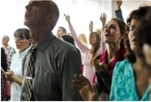
Mennesker i lovsang

Mange menigheter/forsamlinger, menighetsmedlemmer, predikanter og menighetsledere er opptatt av vekkelse. De ber om og ønsker at vekkelse skal inntreffe, og det hevdes at de lengter etter vekkelse. Det kan nesten bli et noe krampaktig fokus på temaet. Spesielt innenfor den (ekstrem) karismatiske leir er det forholdsvis normalt med et svært stort fokus på vekkelse.