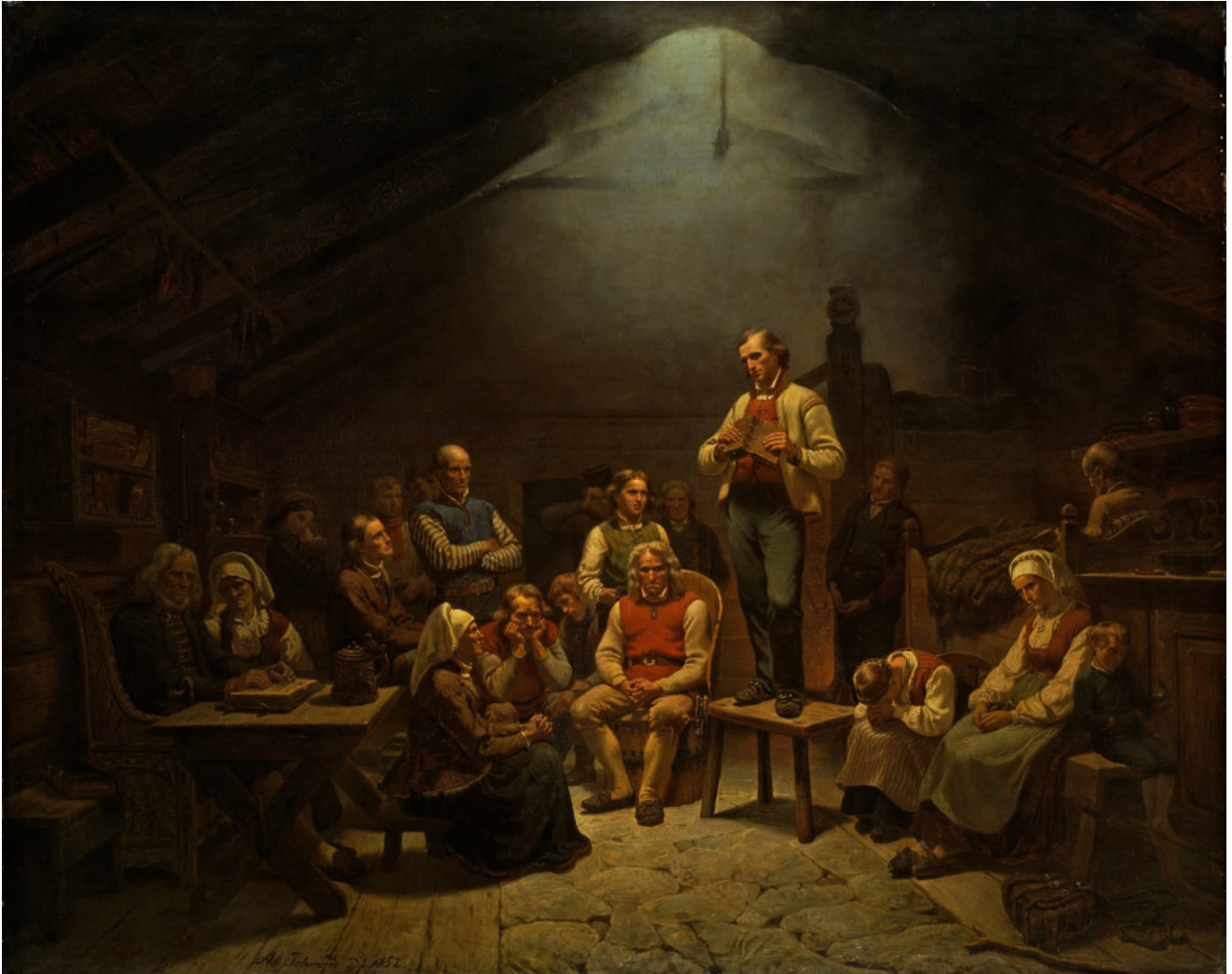
Foto av bildet “Haugianerne” fra 1848, malt av Adolph Tidemand. Bildet viser en lekpredikant tilknyttet haugianerbevegelsen (jf. Hans Nielsen Hauge) som var en norsk kristen vekkelsesbevegelse på begynnelsen av 1800-tallet.

Troende kristne kan nok innimellom trenge en åndelig oppvåkning . Man kan bli litt “sløve” i troen og utøvelsen av den. Imidlertid er det ikke alt som skjer i kristne rekker jeg kan støtte eller stå inne for.