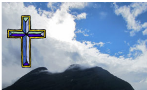
Himmel, fjell og kors

Jeg tror absolutt på at vekkelse kan finne sted. Imidlertid er det masse eksempler på feilslåtte profetier om forestående vekkelser. Mange spådde vekkelser har det ikke blitt noe av. Andre vekkelser har funnet sted, men fort dabbet av og ikke blitt noe særlig langvarig eller holdbart.