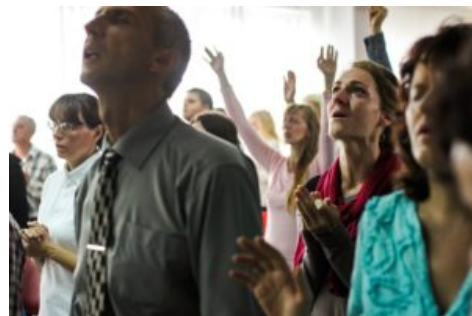
Mennesker i lovsang

Mange menigheter/forsamlinger, menighetsmedlemmer, troende kristne, predikanter, pastorer og menighetsledere er opptatt av vekkelse . De ber om og ønsker at VEKKELSE skal inntreffe, og det hevdes at de lengter etter vekkelse. Det kan nesten bli et noe krampaktig fokus på temaet. Spesielt innenfor den (ekstrem) karismatiske leir er det forholdsvis normalt med et svært stort fokus på vekkelse.