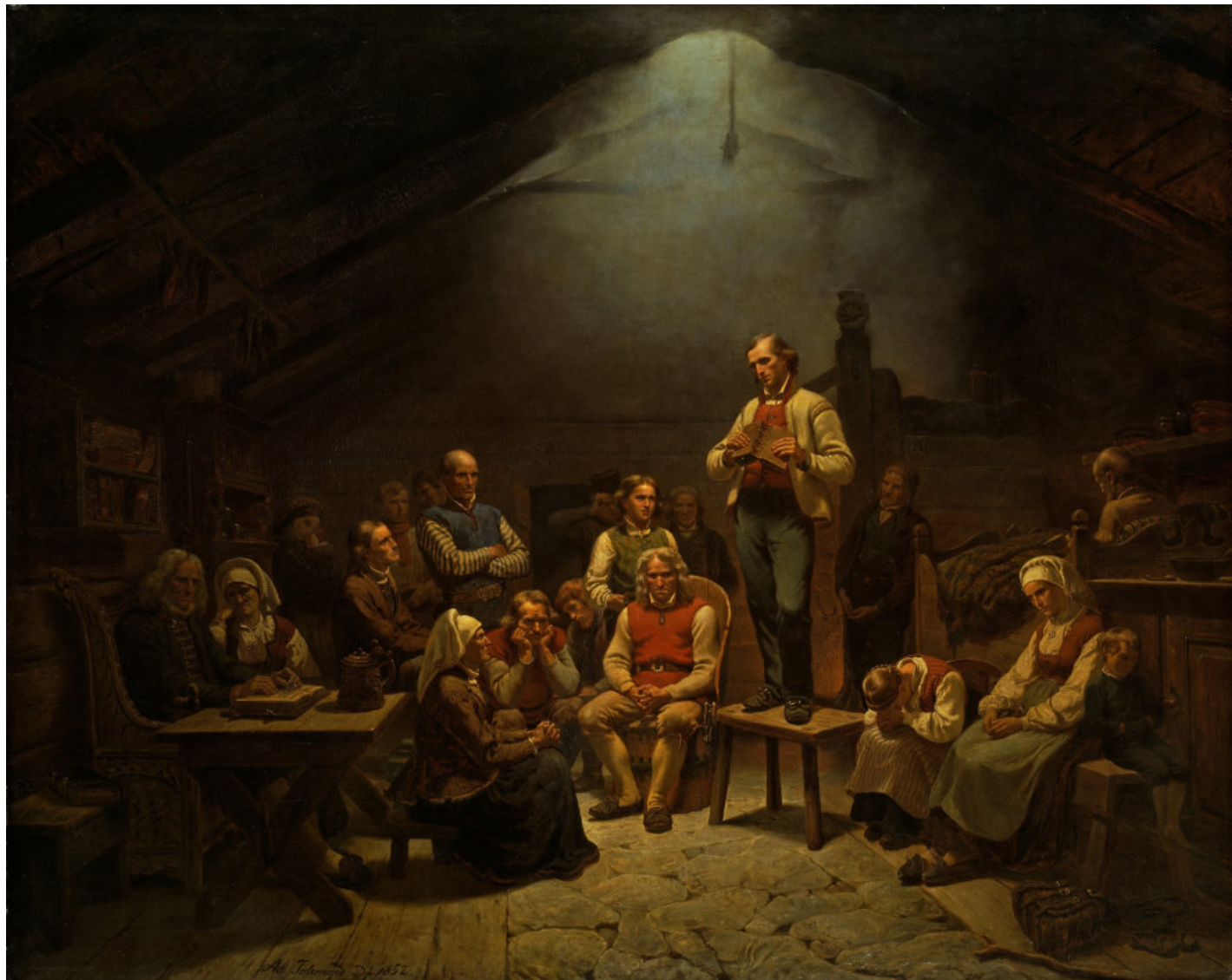
Foto av bildet "Haugianerne" fra 1848, malt av Adolph Tidemand. Bildet viser en lekpredikant tilknyttet haugianerbevegelsen (jf. Hans Nielsen Hauge) som var en norsk kristen vekkelsesbevegelse på begynnelsen av 1800-tallet.

Vekkelse er det ene ytterpunktet. På "motsatt" side har man dem som ikke gjør noe som helst i påvente av nok frimodighet . Først må man bli fylt opp med frimodighet og mot for å kunne gå ut for å gjøre noe for Gud, og det kan gå årevis med dette fokuset. Hva i all verden skal man med all den frimodigheten, og når har man fått nok startkapital av frimodighet til å kunne påbegynne jobben med å spre det glade budskap? Man bør vel starte med å være en hverdagskristen og et godt medmenneske som utviser nestekjærlighet i hverdagen, og ikke bare bure oss inne på bedehuset.