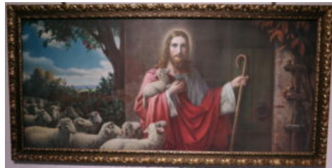
Jesusbilde hvor Jesus står for døren og banker.

Den enkelte må ta sitt valg om man ønsker eller ikke ønsker å tro på Bibelens budskap. For dem som måtte velge å ta imot det kristne budskapet for første gang kan også dåp være aktuelt, hvis de ikke er døpt fra før. (Selv er jeg ikke noen fan av gjendåp!)