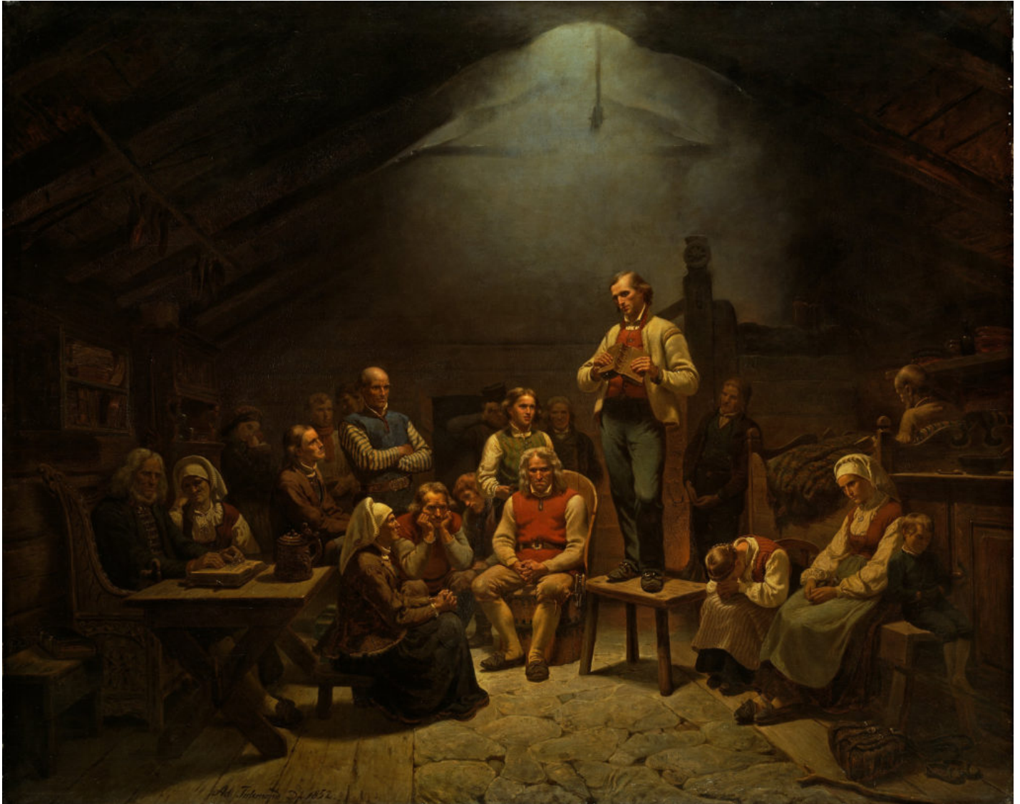
Foto av bildet "Haugianerne" fra 1848, malt av Adolph Tidemand. Bildet viser en lekpredikant tilknyttet haugianerbevegelsen (jf. Hans Nielsen Hauge) som var en norsk kristen vekkelsesbevegelse på begynnelsen av 1800-tallet.

Vekkelse er det ene ytterpunktet. På "motsatt" side har man dem som ikke gjør noe som helst i påvente av nok frimodighet . Først må man bli fylt opp med frimodighet og mot for å kunne gå ut for å gjøre noe for Gud, og det kan gå årevis med dette fokuset. Hva i all verden skal man med all den frimodigheten, og når har man fått nok startkapital av frimodighet til å kunne påbegynne jobben med å spre det glade budskap? Man bør vel starte med å være en hverdagskristen og et godt medmenneske som utviser nestekjærlighet i hverdagen, og ikke bare bure oss inne på bedehuset.