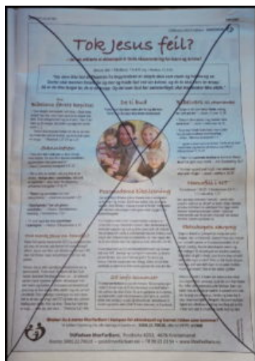
MorFarBarn-annonse i Vårt Land

Normalt sett er jeg noe skeptisk til medierådgivere og kommunikasjonsrådgivere. Imidlertid kunne nok stiftelsen omtalt i denne artikkelen ha trengt noen slike. Slik budskapet deres presenteres pr. dags dato er det mange som kan føle seg trødd på og støtt av budskapet de serverer. Noe av det militante språket kunne med fordel ha vært fjernet.