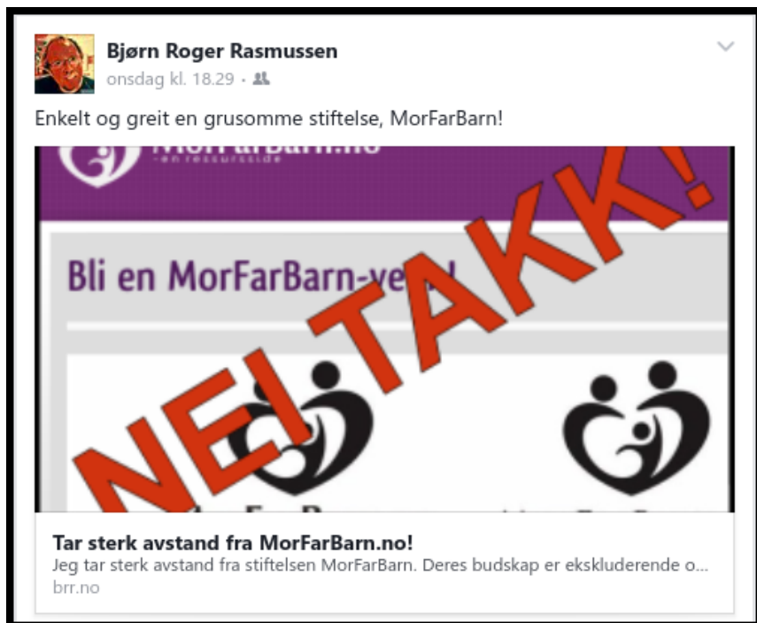
MorFarBarn, nei takk! Min Facebook-status januar 2017

I sitt propagandamateriell skriver MorFarBarn en del om adopsjon. I hovedsak ser det ut for at de er imot adopsjon når det er snakk om homofile (LHBTI-miljøet) og enslige, noe som da ikke rammer meg direkte. Imidlertid har de også noen uheldige formuleringer som klarer å provosere meg som en heterofil gift adopsjonsfar. Jeg tenker da på formuleringer slik som: