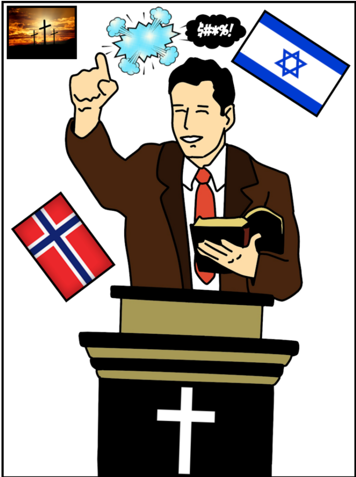
Predikant i action.

I enkelte menigheter kan det virke som om hovedmottoet er: “Kom som du er, men bli som oss!” . Å være seg selv – muligens litt annerledes enn det “normale” – er det lite rom for. Man må “legge av” (ofre) deler av seg selv, og man må gå på kompromisser med sin identitet og det man står for. Det er ikke gitt at alle passer inn i de smale og trange rammene til en menighet eller forsamling.