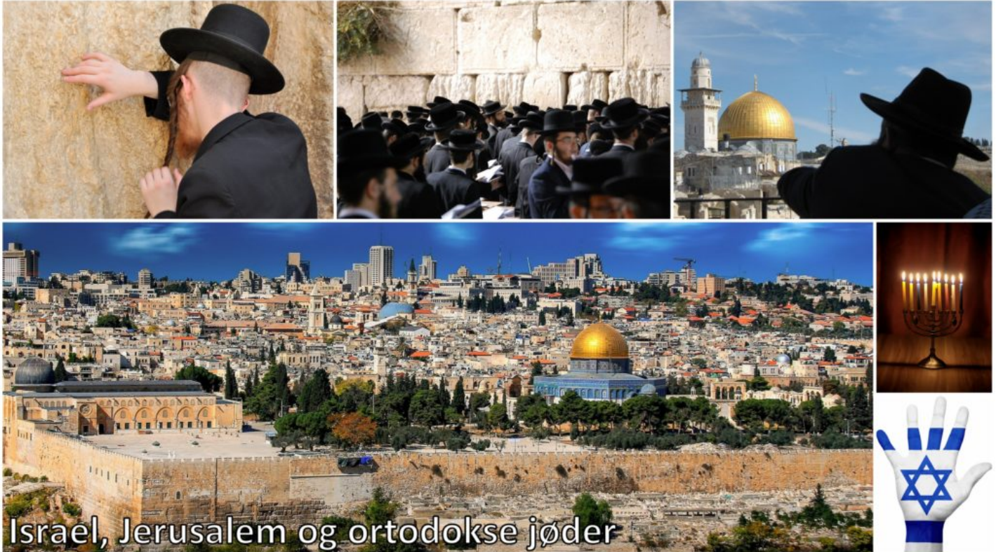
Israel, Jerusalem og ortodokse jøder

Det finnes selvsagt ekstreme eller fundamentalistiske muslimer , gjerne med arabisk/palestinsk avstamning, som ønsker Israel og jødene bort. Det finnes dem som vil ha Israel utslettet fra kartet (f. eks. Iran). Imidlertid er det litt for enkelt å generalisere og si at alle muslimer og/eller arabere er slik. Det finnes også mange blant disse som mest av alt ønsker fred og levelige forhold for alle i Israel og landene rundt.